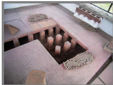
Praetorium - Locuința comandantului și reconstituirea camerei cu hypocaust.

Horreum (Magazia de cereale) - situat în partea dreaptă a Pirncipiei, în apropiere de Porta Principalis Dextra -era construit din piatră și acoperit cu țigle și olane. Fiind o clădire destul de înaltă, zidurile erau susținute de contraforți, câte opt pe laturile lungi și trei pe cea din spate. Podeaua era din lemn susținută pe bârne groase fiind ridicată deasupra solului. Pe sub podea pătrundea aerul venit din exterior pe niște guri de aerisire (câte trei pe laturile lungi). Scopul acestui sistem era să asigure