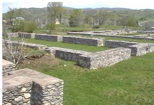
Horreum - Magazia de cereale.

Horreum (Magazia de cereale) - situat în partea dreaptă a Pirncipiei, în apropiere de Porta Principalis Dextra -era construit din piatră și acoperit cu țigle și olane. Fiind o clădire destul de înaltă, zidurile erau susținute de contraforți, câte opt pe laturile lungi și trei pe cea din spate. Podeaua era din lemn susținută pe bârne groase fiind ridicată deasupra solului. Pe sub podea pătrundea aerul venit din exterior pe niște guri de aerisire (câte trei pe laturile lungi). Scopul acestui sistem era să asigure