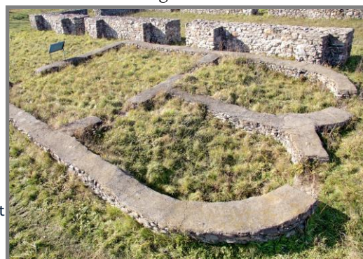
Clădirea cu dublă absidă - sediul ofițerilor.

condiții optime de păstrare a cerealelor, ferindu-le în primul rând de umiditate. În comparație cu alte magazii descoperite în alte castru de dimensiunile celui de la Jidova, aceasta are o suprafață destul de mare - 384 m 2 .