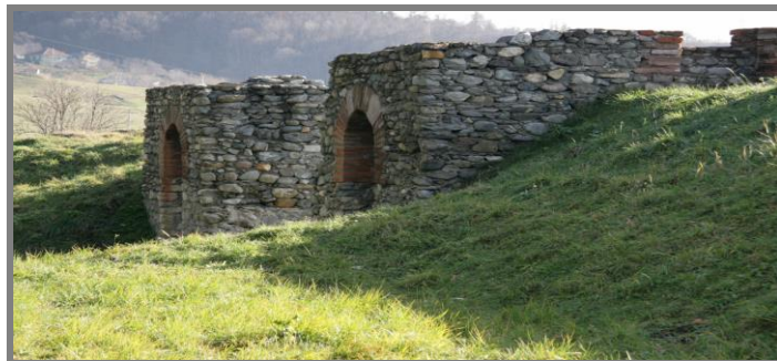
Porta Praetoria - Poarta principală, pe latura de sud ( vedere din interiorul incintei)

Cele patru porți erau legate printr-o rețea stradală. De la Porta Pretoria pornea până la Principia (Comandamentul), Via Pretoria. Porțile laterale, Porta Principalis, Dextra și Sinistra erau unite de Via Principalis, care trecea prin fața clădirilor principale ale castrului. Din spatele Principiei pe axul central al castrului pornea până la Porta Decumana, Via Decumana. Porțile erau flancate de câte două turnuri. Pe lângă acestea castrul era prevăzut cu turnuri curtină, situate între turnurile de poartă și cele de colț, câte două pe laturile scurte ale castrului și trei pe laturile lungi. Turnurile de porți și curtină erau patrulatere, iar cele de colț aveau formă semicirculară și posedau la nivelul înălțimii agger-ului platforme de luptă. Turnurile de porți și de curtină erau ieșite în afara zidurilor de incintă cu 30-40cm.